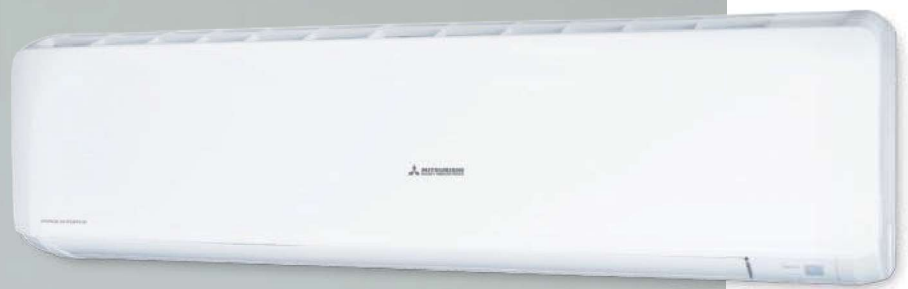
SRK63ZR-W, SRK71ZR-W, SRK80ZR-W RAL9003