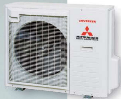
SRC71ZR-W, SRC80ZR-W RAL7044